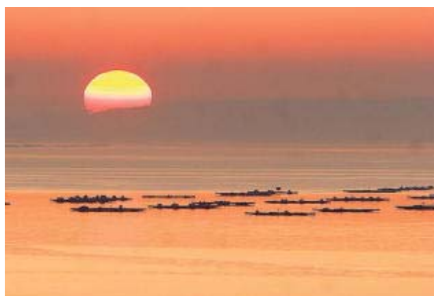
Uno de los polígonos bateeiros de la ría de Arousa.

No menos importante resulta que exista una enorme variedad entre los cultivos, con 3.362 cuadrículas dedicadas a mejillón, 101 para ostra, 75 de policultivos y 193 instalaciones de carácter experimental.