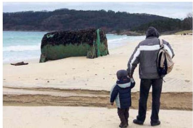
Un flotador de una de las bateas de Liméns que el temporal destrozó y que acabó en la playa de Nerga, en Cangas.