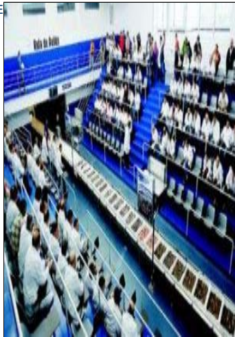
Vista panorámica de la nueva rula el día de su inauguración en mayo pasado.