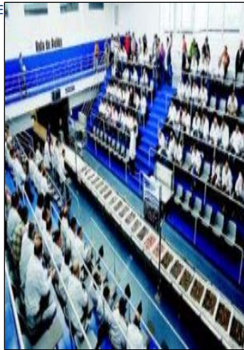
Vista panorámica de la nueva rula el día de su inauguración en mayo pasado.