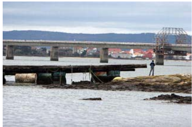
Una batea encallada en una zona de rocas de O Castelete (Vilanova).

El sector del mar suele estar entre los más vulnerables cuando se produce un temporal. En el caso del Xynthia existe preocupación ante los efectos de una riada de agua dulce en los bancos marisqueros situados cerca de la desembocadura de los grandes ríos, y ante la posibilidad de que el fuerte oleaje del fin de semana causase el desprendimiento del mejillón y las ostras de las bateas. En el caso de A Illa, la mayoría de los armadores que trasladaron sus barcos a Vilanova y Vilagarcía entre el viernes y el sábado esperarán a hoy para regresar a su puerto.