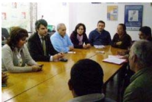
▼ Los mariscadores en la reunión que mantuvieron con el PA.

La asociación Virgen del Carmen considera "injusto" que no se les haya dado la subvención